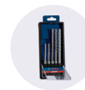
Hammer- bohrersatz BOSCH